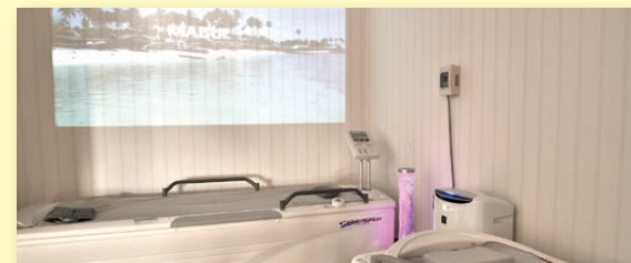
リラクゼーション