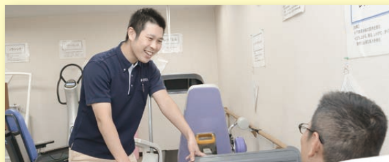
筋カトレーニング

赤外線センサーを使って重心移動やバランス評価もできます。また、情報を見る化することで、運動意欲の向上にもつながります!