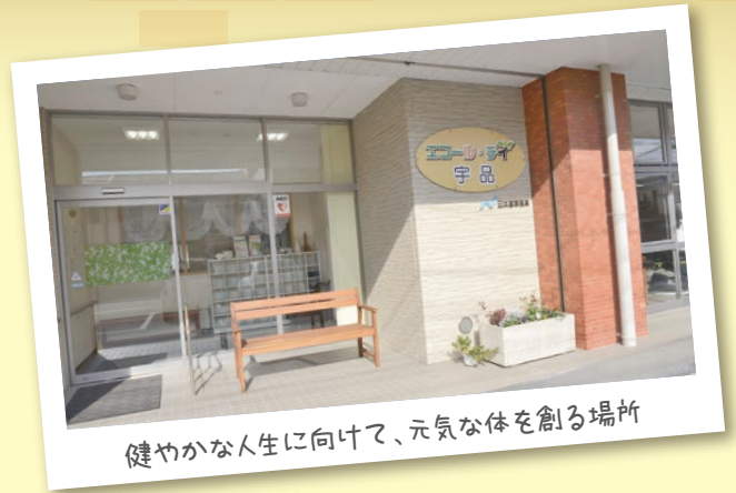
健やかな人生に向けて、元気な体を創る場所

エコール・デイ宇品では、ご利用者様の想いに添った、きめ細やかなサービスをご提供させていただいております。 「こうなりたい」に寄り添い、「やってみたい」を尊重し、「また来よう」と思っただけ、そんなデイサービスを目指していきたいと考えています。 エコール・デイ宇品での生活を通して、心も体も元気になっていただきたい。それが私たちの願いです。